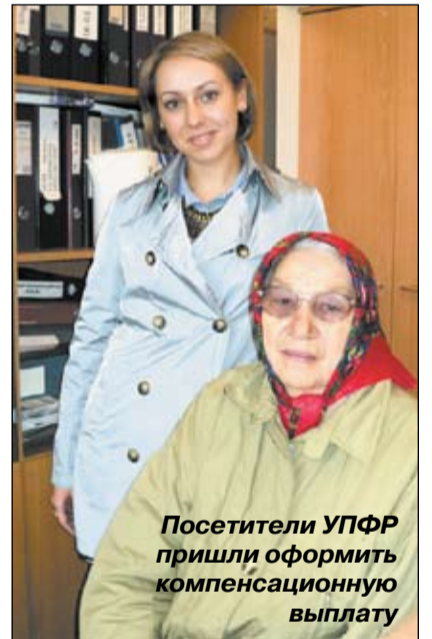
Посетители УПФР пришли оформить компенсационную выплату

Обращаем ваше внимание на то, что число жителей Ленинского района, нарушающих одно из обязательств в части несообщения об устройстве на работу, не сокращается, что влечет переплаты по выплате ежемесячных и компенсационных выплат. В первом квартале 2013 года выявлено около 300 тыс. рублей пе-