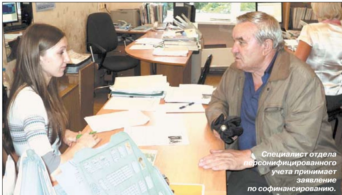
Специалист отдела персонифицированного учета принимает заявление по софинансированию.

го учета провела более 12 встреч с представителями заводов, школ, салонов красоты, открытых акционерных обществ, советом ветеранов, жилищно-коммунальных организаций, детских садов, больниц Ленинского района. По итогам, за последний